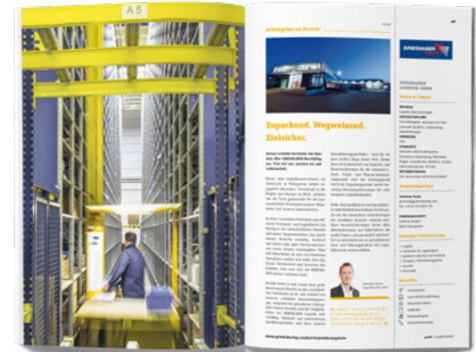
1/1 Seite + Anzeige

Zusätzlich buchbar: Wir erstellen für Sie Ihr Arbeitgeberporträt. Einzelseite PR 600 EUR / Doppelseite PR 1.000 EUR Fotografie auf Anfrage