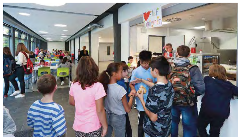
Die neue Schulcafeteria wird von den Schülerinnen und Schülern gut angenommen.

den Lärm in den benachbarten Unterrichtsräumen abzuhalten. Im weiterhin wird eine neue Schülerküche eingerichtet, sowie ein Hauswirtschaftsraum und ein Raum für textiles Werken. Damit die Räume hell und luftig werden, sind Lichthöfe und bodentiefe Fensterelemente vorgesehen. Eine offizielle Eröffnung kündigte der OB für Februar an, „wir machen dann gleich alles zusammen.“ Dann soll mit einem Fest der neue Fachklassentrakt eingeweiht und der Startschuss für den weiteren Ausbau des Galgenbergschulzentrums gegeben werden.