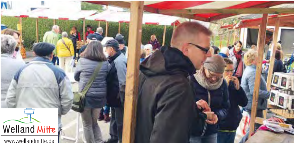
Gut besucht war der Dewanger Herbstmarkt.