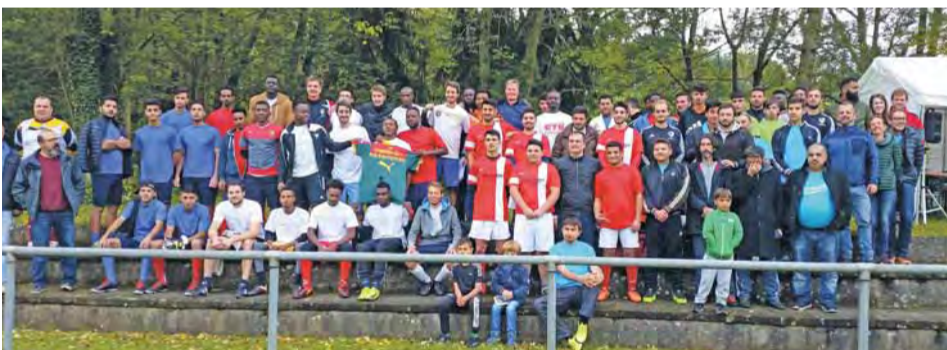
Knapp 100 Spieler nahmen am Fußballturnier teil.