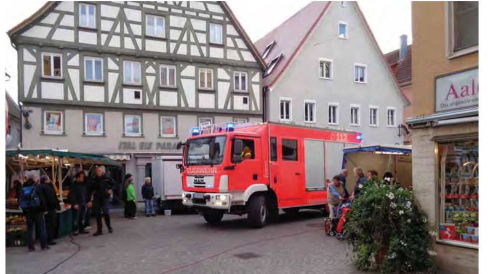
Feuerwehrkontrollfahrt in der Innenstadt.