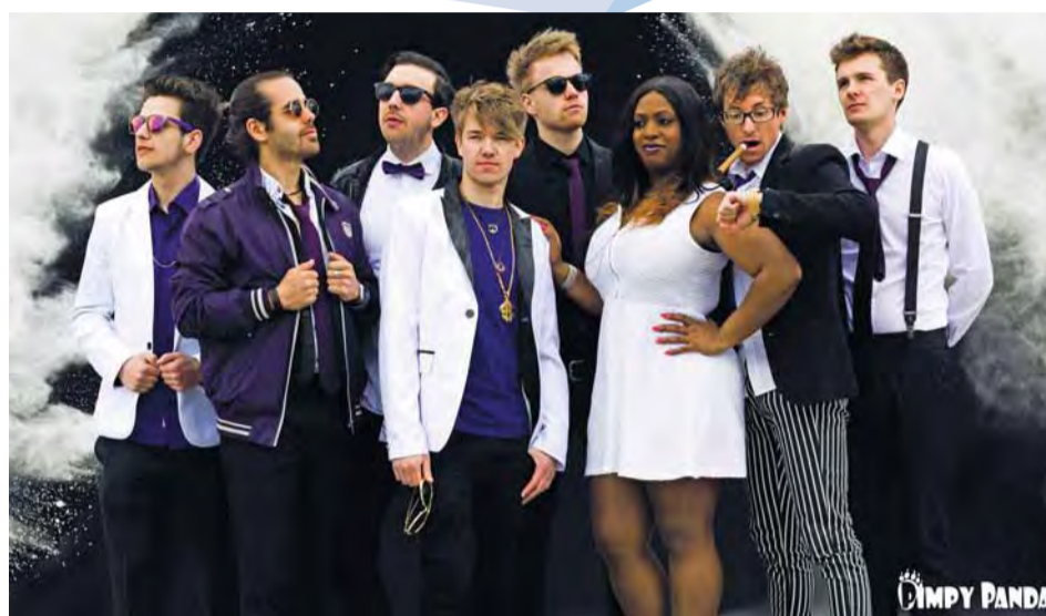
„Pimpy Panda“ - Donnerstag, 9. November im Petite Bellevue.

21 Uhr, Petite Bellevue BAMBOOFY YOUR MIND: PIMPY PANDA