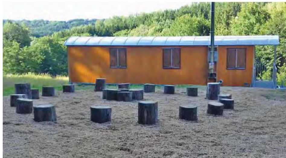
Der Waldwagen mit Hurgelplatz für den Morgenkreis.

Seit Anfang Juli 2017 gibt es im Bodenbachtal in Treppach auf einem städtischen Grundstück den vom Verein wafavi getragenen Waldkindergarten. Mitten in einer Wiese steht ein speziell für die Bedürfnisse der Kinder gebauter und eingerichteter Waldwagen. Von Montag bis Freitag werden von 7.30 Uhr bis 13.30 Uhr derzeit sechs Kinder von zwei Erzieherinnen und einem Praktikanten betreut. Kurzentschlossene können noch freie Plätze zum Jahresbeginn 2018 oder sogar noch in diesem Herbst angeboten werden.