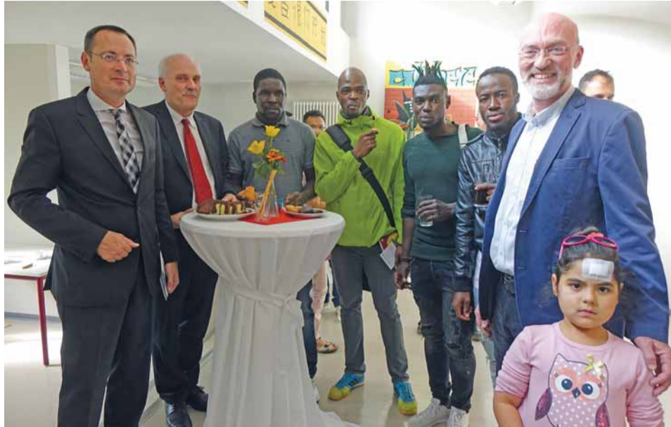
Das Begegnungscafé ist jeden Mittwoch von 16 bis 18 Uhr geöffnet.