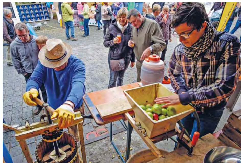
Frisch gepresster Apfelsaft aus der Region.

www.tag-der-regionen-aalen.de Aktuelles auf Facebook https://www.facebook.com/tagderregionenaalen/ www.tag-der-regionen.de