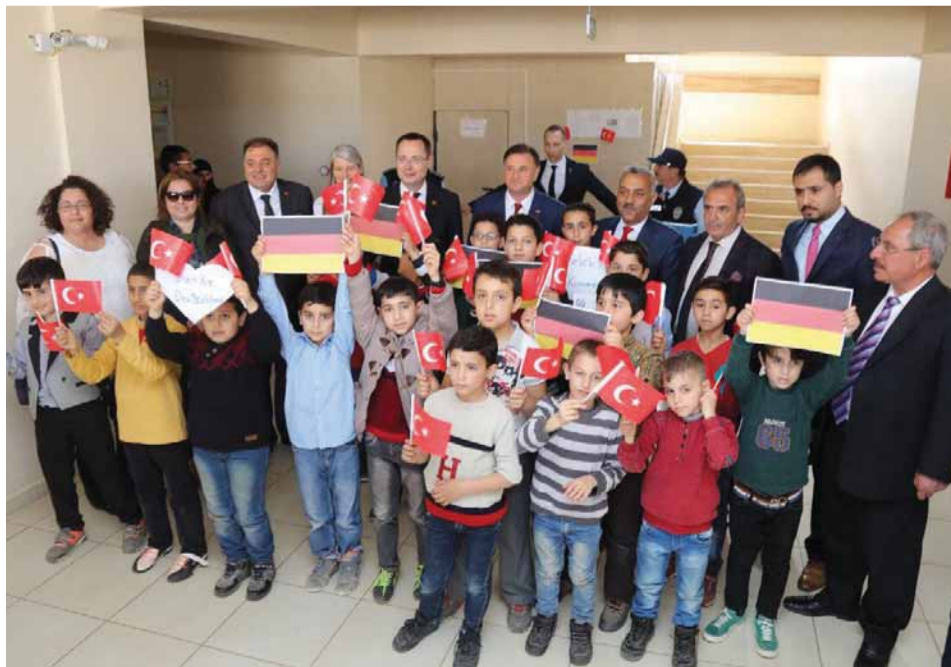
Besuch in der fertiggestellten Schule in Reyhanli im April diesen Jahres.

Teilnahme an der Eröffnungsfeier des Sportplatzes in Reyhanli fest eingeplant