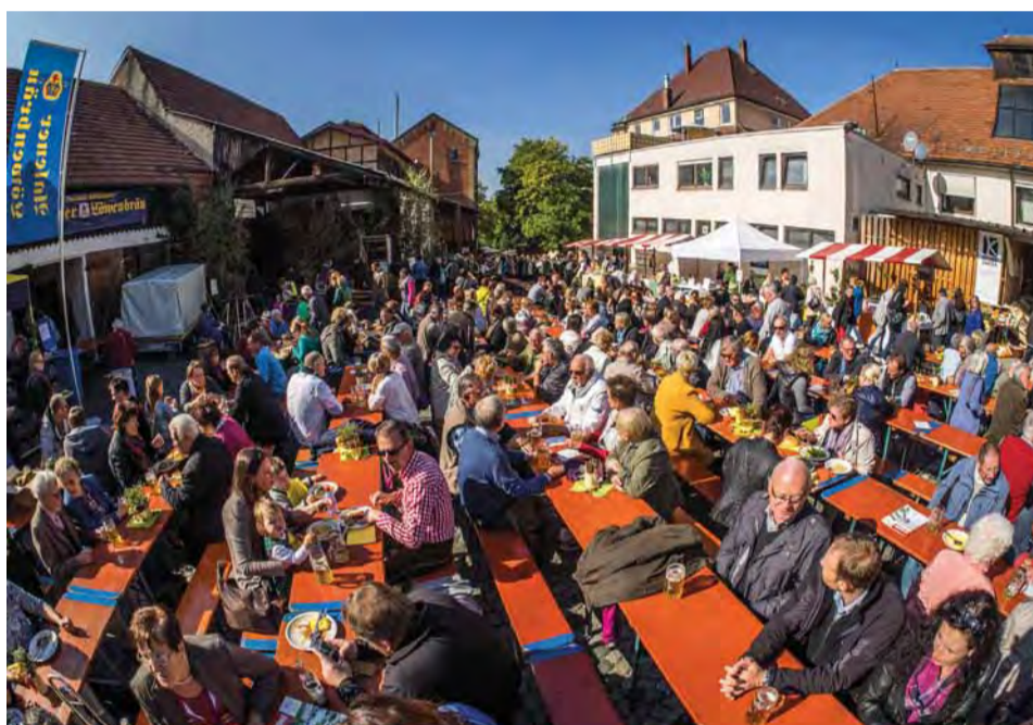
Strahlender Sonnenschein beim Tag der Regionen 2016.

Zum zwölften Mal findet am Dienstag, 3. Oktober 2017 der „Tag der Regionen“ im Innenhof der Aalener Löwenbräu statt.