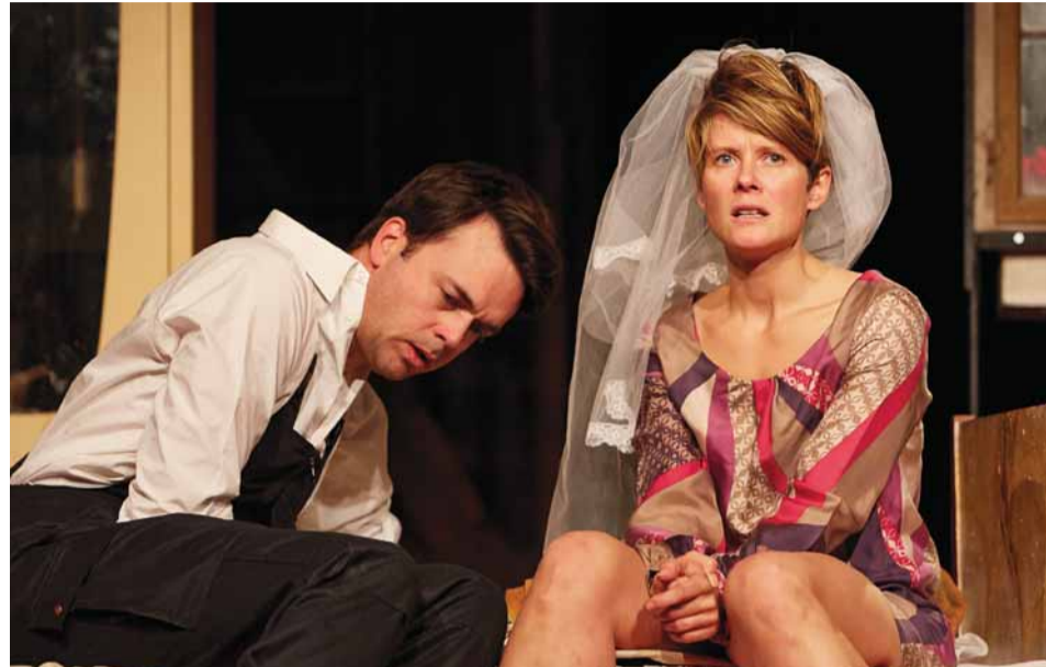
Szenenfoto aus „Emmas Glück“.