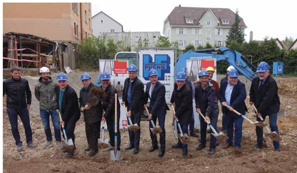
Spatenstich in der Düsseldorfer Straße für das Haus Klara