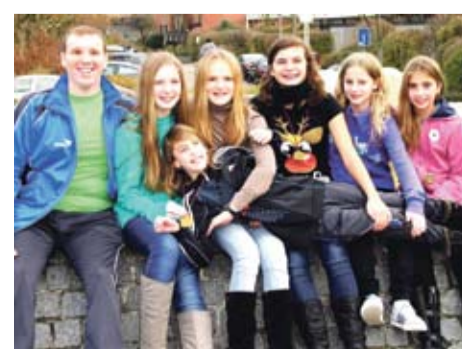
DMS Mannschaft weibl. Jugend D (SC Delphin)

Sportart: Schießsport Erfolg: Deutsche Pokalsieger