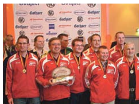
Luftpistole gemischt (Schützenka- meradschaft Aalen-Neßlau)

Sportart: Ringen Erfolg: 3. Platz Deutsche Meisterschaft