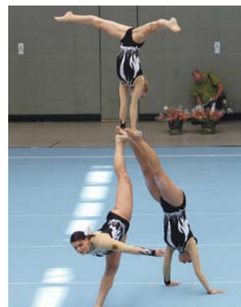
Damengruppe Seniorinnen (TSG Hofherrnweiler-Unterrombach)

Sportart: Schwimmen Erfolg: Württ. Meisterschaft