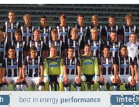
U17-Fußball-Mannschaft (VfR Aalen)

Sportart: Fußball Erfolg: Württ. Pokalsieger