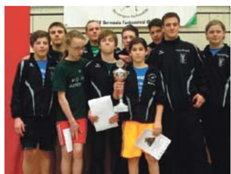
Jugendmannschaft (KG Fachsenfeld/Dewangen)

Sportart: Fußball Erfolg: Württ. Pokalsieger