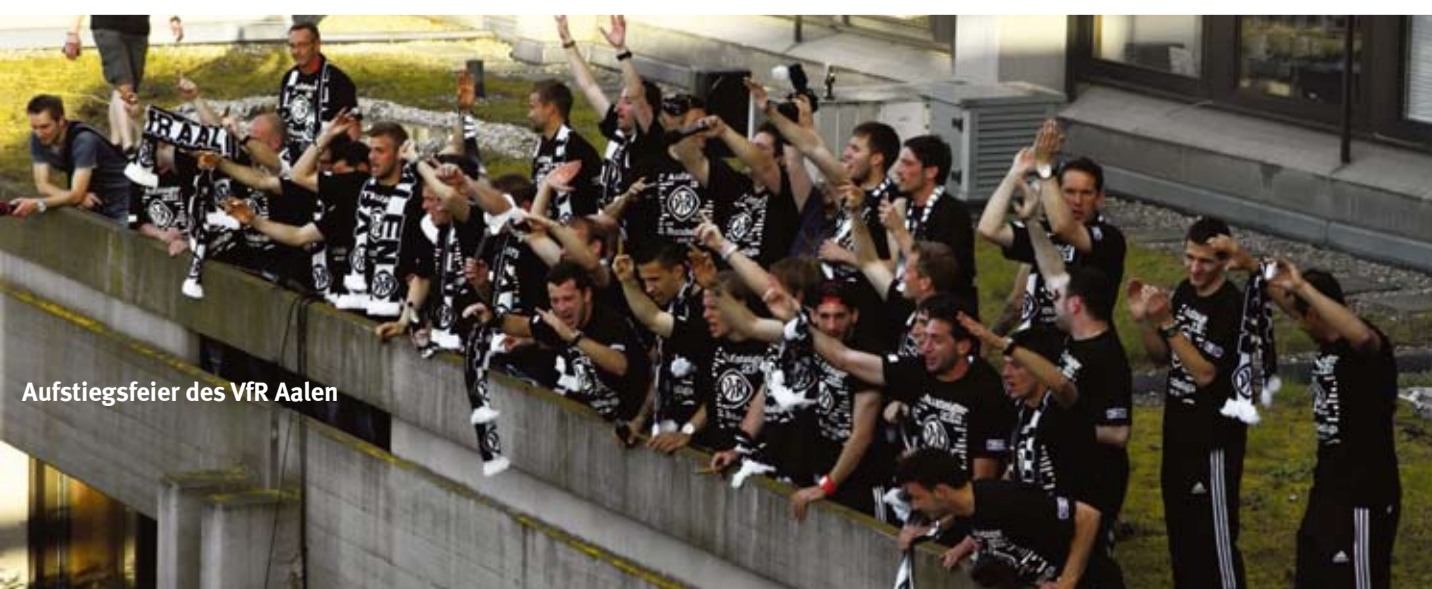
Aufstiegsfeier des VfR Aalen

Die Wohnungsbau Aalen beginnt im Beisein von Oberbürgermeister Gerlach mit einem offiziellen Spatenstich den 3. Bauabschnitt im Amselweg .