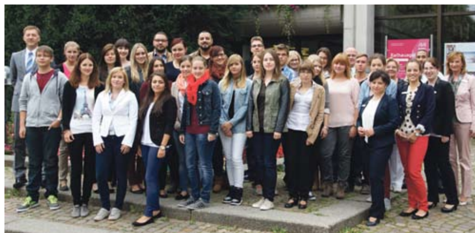
OB Martin Gerlach begrüßt mit Vertretern des Personalamtes und des Personalrats die 27 neuen Auszubildenden vor dem Rathaus.

27 junge Erwachsene sind heute in ihr Berufsleben bei der Stadt Aalen gestartet. Oberbürgermeister Martin Gerlach hieß die Auszubildenden am Einführungstag im Aalener Rathaus herzlich willkommen.