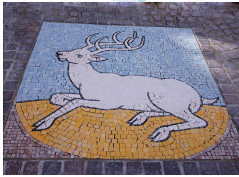
Das Cervia-Wappen ist nun auf dem oberen Marktplatz zu sehen.