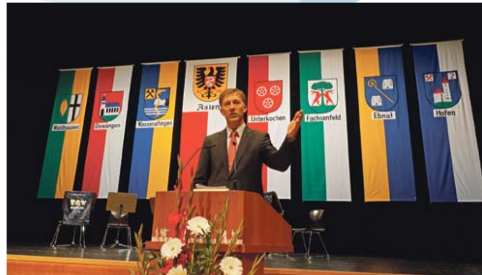
Zum Schluss zieht der scheidende Oberbürgermeister eine positive Bilanz und verabschiedet sich mit einem herzlichen „Glück Auf“.

„Dieser Verantwortung sind Sie in außergewöhnlicher Weise gerecht geworden. Als Beispiele nenne ich den Lehrstuhl für erneuerbare Energien an der Hochschule Aalen, die erste Telekom-Musterstadt beim Breitband-Ausbau und die Städtepartnerschaften.“