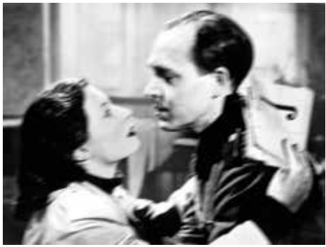
Titelbild aus dem DEFA-Film „Ehe im Schatten“, D 1947