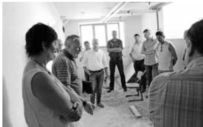
Architekt Reiniger legte die weiteren Bauschritte dar.

Bauhof wurden auch die Container der Gemeinschaftsschule, die Umbaumaßnahmen der Grundschule, die Fahrradständersituation am Marktplatz, die Hochwasserschutzmaßnahme im Bereich Kastanienallee sowie die städtischen Gebäude der Gemeinde Daugendorf besichtigt, um sich einen Überblick über die derzeitige Situation zu verschaffen. In den nächsten Sitzungen wird über das zukünftige Vorgehen beraten.