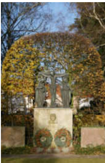
Kriegerdenkmal Friedhof Riedlingen - W. Abfalg