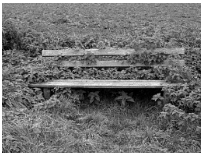
Bank vor der Aktion