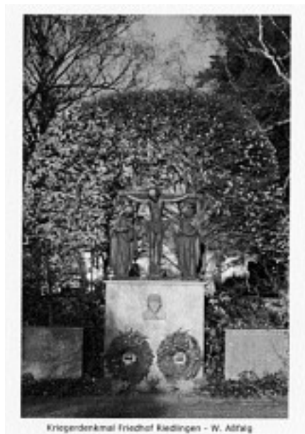
Kriegerdenkmal Friedhof Riedlingen - W. Adlitz

Ökumenischer Gottesdienst ist um 10.30 Uhr in der Stadtpfarrkirche St. Georg. Im Anschluss daran findet die zentrale Gedenkfeier am Ehrenmal auf dem städtischen Friedhof in Riedlingen statt.