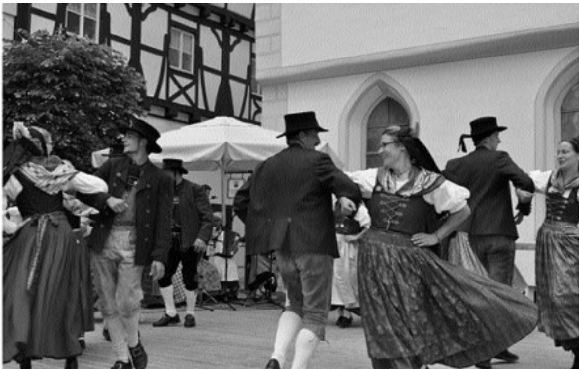
Danzlescht Fröhlichkeit prägte das Landesfest des Schwäbischen Albvereins in Riedlingen, so auch am Samstagabend beim Danzlescht.

Albvereins. Hunderte ehrenamtlicher Helfer waren notwendig, um zusammen mit den hauptamtlichen Mitarbeiterinnen und Mitarbeitern der Landesgeschäftsstelle des Schwäbischen Albvereins dieses Fest vorzubereiten und erfolgreich durchzuführen. Für die Ehrenamtlichen aus dem Gau, der