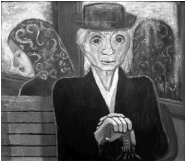
In der Straßenbahn. Acryl/Öl auf Hartfaser. 1952

Verantwortlich für Redaktionelles: Bürgermeister H. Petermann · Tel. 07371/18312 · Fax 18355 · E-Mail cbarth@riedlingen.de (sh. Impressum) www.riedlingen.de