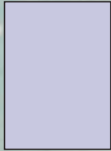
1/1 Seite 184 x 257 mm 210 x 297 mm