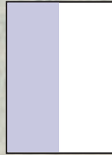
1/2 Seite hoch 88 x 257 mm 101 x 297 mm