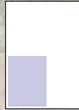
1/4 Seite Eck 88 x 126 mm